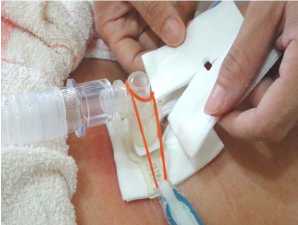
圖 9-9 缺口朝頭部，圍住氣切造口，使Y型紗布切面及內面完全且平整覆蓋住氣切造口。