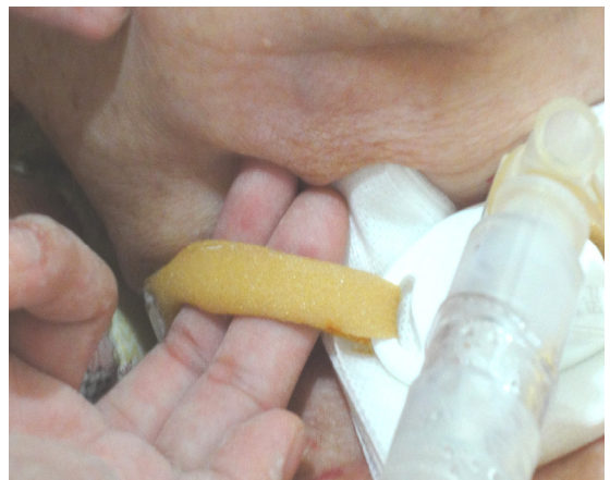
圖 9-1 氣切固定帶的鬆緊度，以 1~2 隻手指能放入為準。