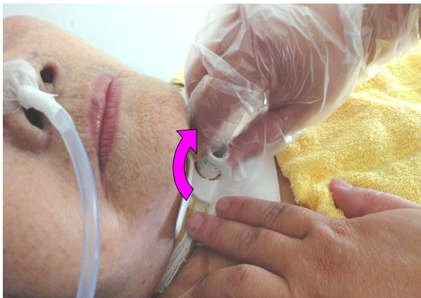
圖 9-15 將內管重置入氣切管內，並順時針旋轉固定。