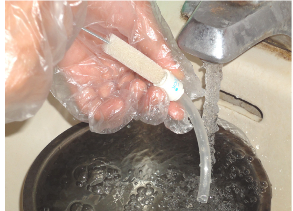
圖 9-12 將內管置於雙氧水內浸泡約15~20分鐘至痰液脫除，再用刷子清洗。