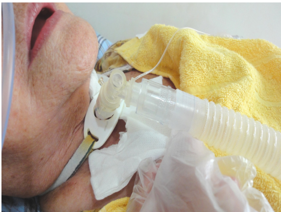
圖 9-5 移除氣切造口髒汙的Y型紗布，丟至汙物袋。