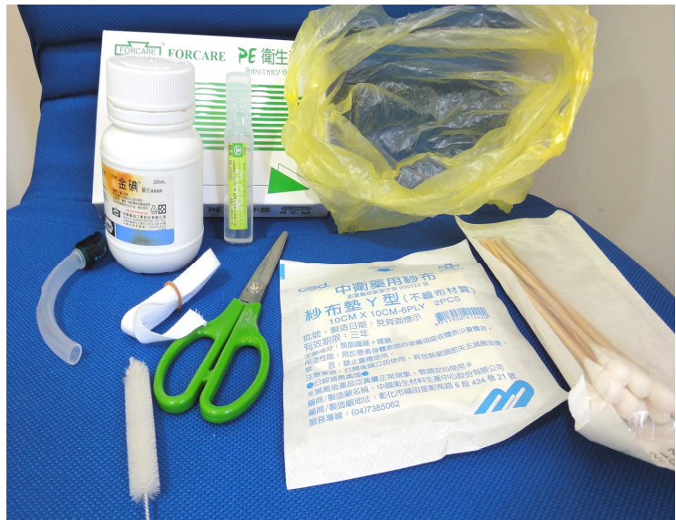
圖 9-2 準備用物。