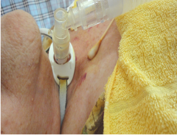
圖 9-7 待30秒後，再以生理食鹽水的棉枝將水溶性優碘擦拭乾淨，並注意氣切造口有無紅腫、出血或異常分泌物等情形。