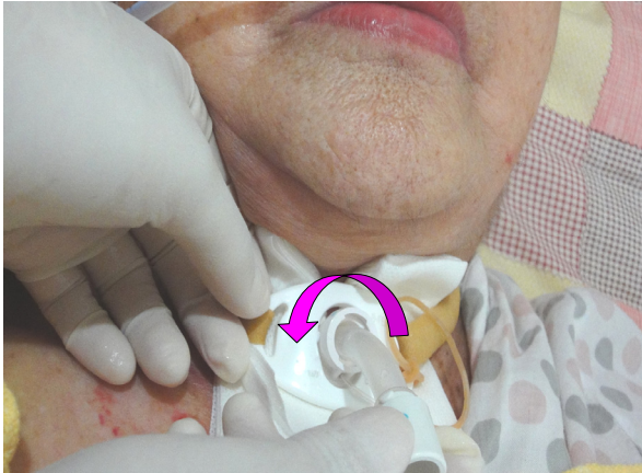
圖 9-11 一手固定氣切管固定翼，另一手將內管以逆時針方向旋轉90度，輕拉出內管。