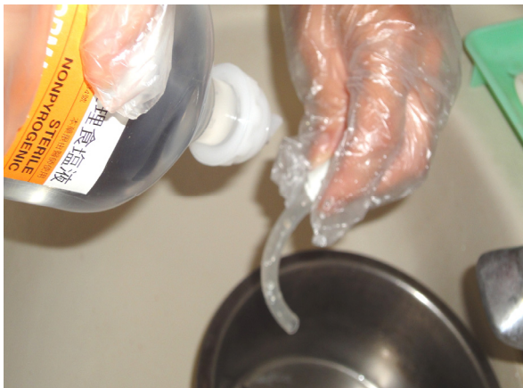
圖 9-13 以生理食鹽水將內管沖洗乾淨。